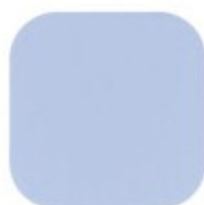
CÉU LIMPO 10.38