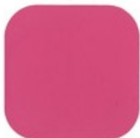
ORQUÍDEA HAVAIANA 10.24