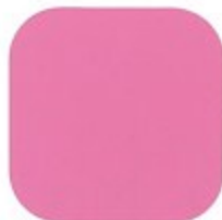
BABY PINK 10.23