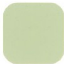
ARGILA BIOLÓGICA 10.42