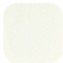
ESPUMA DOS DIAS 10.02