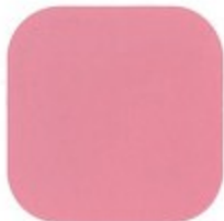
JARDIM JAPONÊS 10.22