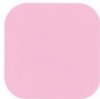
IT GIRL 10.21