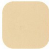
NUPE CLÁSSICO 10.10