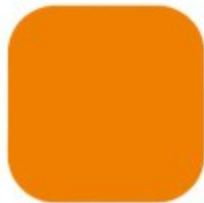
VITAMINA C 10.28