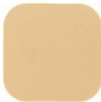
ALGODÃO ORGÂNICO 10.11