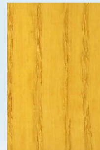
121 - Garapa