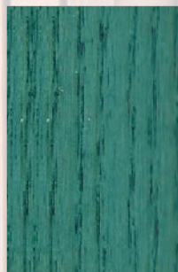
131 - Azul Sulfato