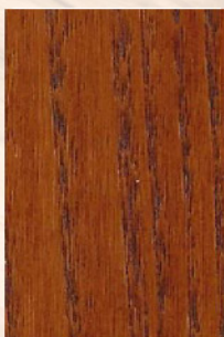
113 - Mutene