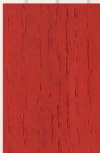
128 - Vermelho 3001

In previously-treated woods, carefully scrape the wood and sanding with sandpaper of medium grain. Shouldn't be used with wet or rainy weather.