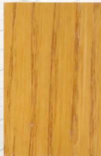
152 - Mel

Shoudn't be used with wet or rainy weather.