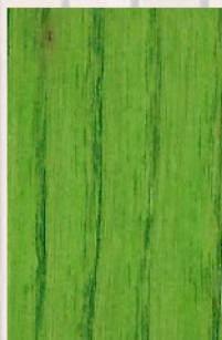
129 - Verde Pistáchio