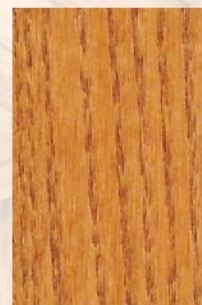
108 - Cerejeira