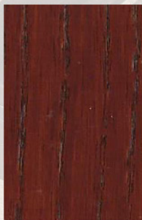
153 - Sucupira