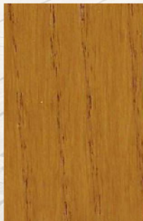
157 - Mogno