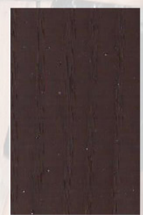
126 - Sucupira