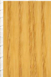
151 - Garapa