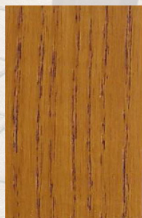
155 - Teca