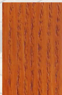
158 - Afzélia