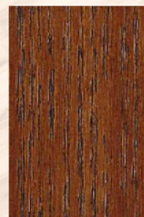
112 - Sucupira