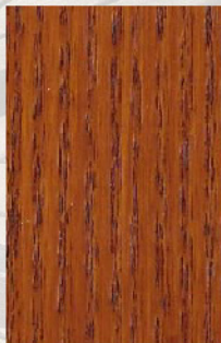
159 - Mutene