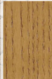
154 - Carvalho