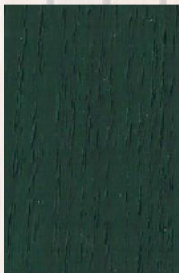
130 - Verde Cato