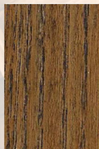
102 - Carvalho