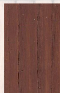
125 - Mutene