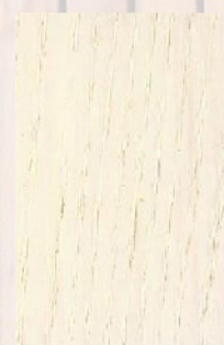
188 - Branco