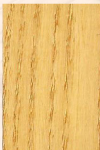
109 - Freixo

The wood should be thoroughly clean and dry. In new timbers, where is necessary an extra protection, especially outdoors, we recommend the application of two coats of Cupivouga colourless. In already painted or varnished wood, should previously be done a pickling or sanding. Apply as in new timbers. Shouldn't be used with wet or rainy weather.