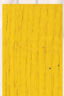
127 - Amarelo 1023