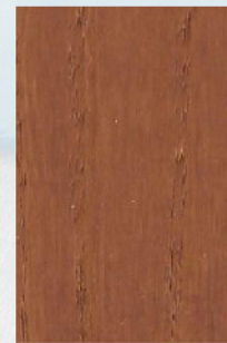
123 - Mogno