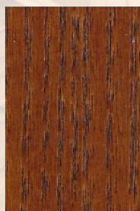
103 - Mogno