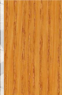
156 - Cerejeira