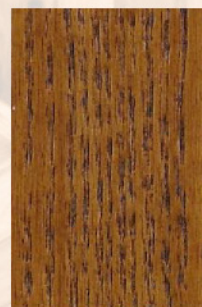
101 - Teca