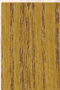
111 - Carvalho Claro