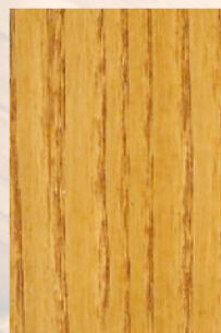
110 - Mel