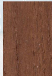
124 - Teca